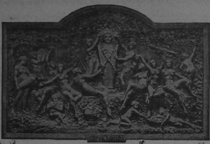
Bajo relieve esculpido en la Creta de las Caves de Pommery & Greno en Reims, representando la Fiesta de Baco